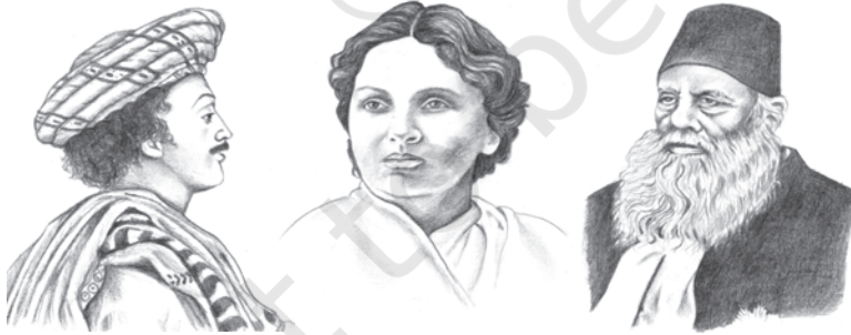
राजा राम मोहन राय