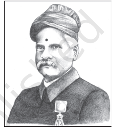
राजा रवि वर्मा

की नवीन प्रविधियों की उपस्थिति मिलती है जो कि तैलीय चित्र के रूप में व्यक्त होती है..... इसकी अन्य विशेषता है स्थानों के वितरण करने की प्रविधि जैसे उम्र और स्तरीकरण के अनुसार बैठे हुए व्यक्तियों की व्यवस्था, उससे 19वीं सदी के उन यूरोपीय चित्रों की याद आती है जिसमें बुरुवा परिवार दिखाए गए हैं। कितने आश्चर्य की बात है कि ये पेंटिंग मातृवंशीय केरल के नायबों की हैं जो कि कृष्णा मेनन की जाति थी, उस वक्त बनायी गई थीं जब वे पितृस्थानीय एकल परिवार से ज्यादा परिचित भी नहीं थे.....”