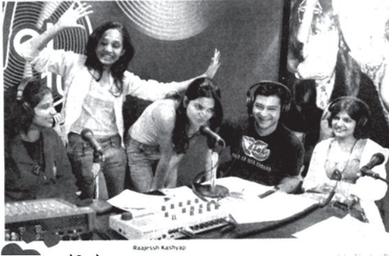
रेडियो गा गा

But what has made RJ-ing the coolest choice? Perhaps, it is the rising level of awareness among youngsters, who want something more and extraordinary when it comes to career. No run of the mill stuff for them because they are willing to risk and experiment. As actress Preity Zinta, who was an RJ in