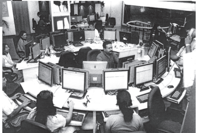
21वीं सदी का दूरदर्शन समाचार कक्ष, भारत

औद्योगिक क्रांति के साथ ही, मुद्रण उद्योग का भी विकास हुआ। कुलीन मुद्रणालय के प्रथम उत्पाद साक्षर अभिजात लोगों तक ही सीमित थे। तत्पश्चात् 19वीं सदी के मध्य भाग में आकर जब प्रौद्योगिकियों, परिवहन और साक्षरता में और आगे विकास हुआ, तभी समाचारपत्र जन-जन तक पहुँचने लगे। देश के विभिन्न क्षेत्रों में रहने वाले लोगों को एक जैसे समाचार पढ़ने या सुनने को मिलने लगे। ऐसा कहा जाता है कि इसी के फलस्वरूप देश के विभिन्न भागों में रहने वाले लोग परस्पर जुड़े हुए महसूस करने लगे और उनमें 'हम की भावना' विकसित